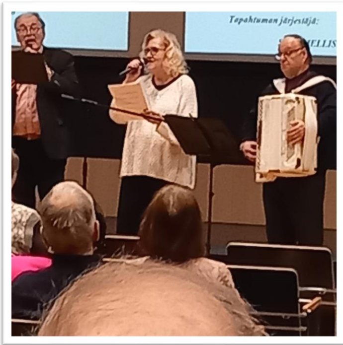
Eläkeliiton Kälviän Yhdistys