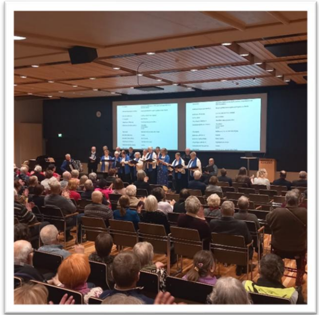
Kokkolan Eläkeläiset uppträder